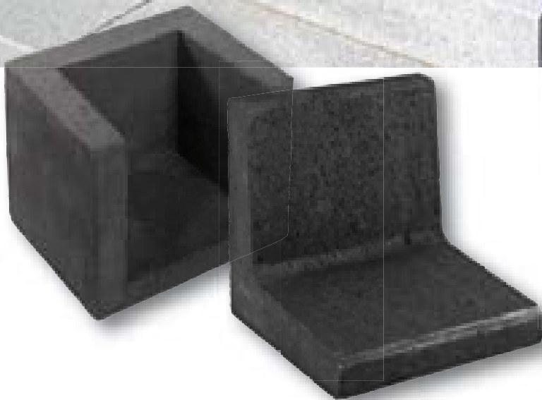
Hoek-element zwart 40 x 40 x 50 cm ook leverbaar in grijs

U-elementen kunt u risicoloos plaatsen door ze op een gestabiliseerd zandbed te zetten (verhouding 1 deel cement: 10 delen zand). Dit voorkomt verzakking.