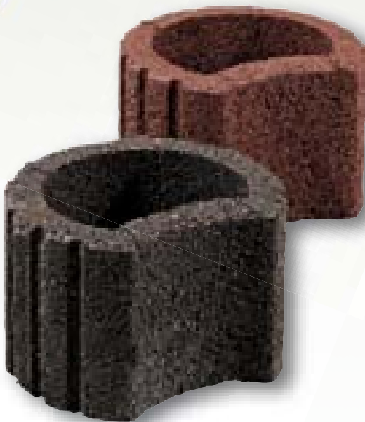
Pintoflor mini zwart/bruin 30 x 25 x 20 cm