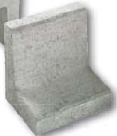
L-element grijs 40/50/60/80 x 40 x 40 cm