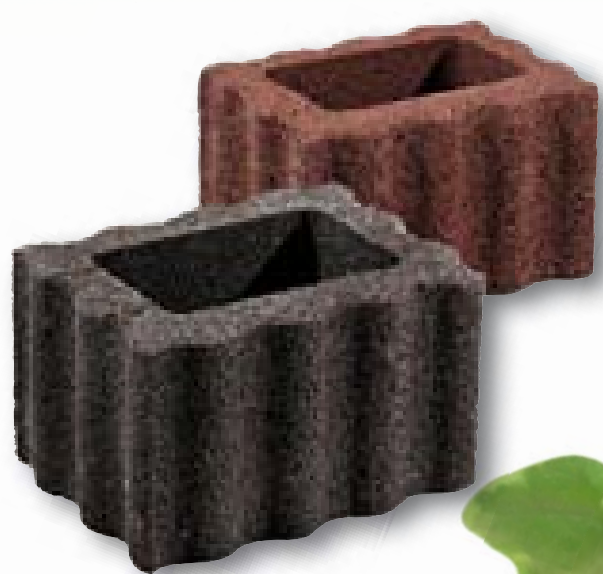
Relufloor mini zwart/bruin 40 x 30 x 25 cm