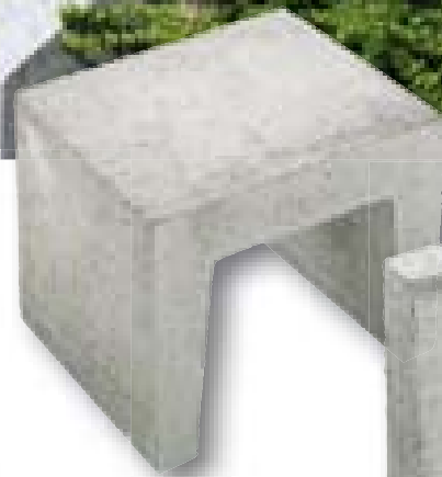
U-element grijs 40 x 50 x 40 cm ook leverbaar in zwart