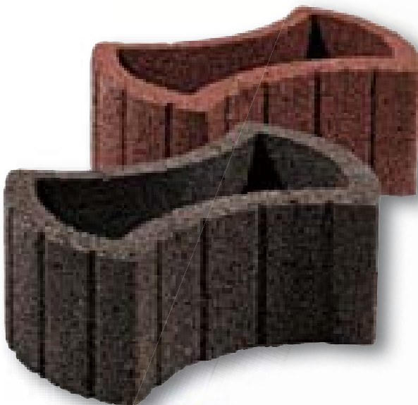
Lusafloor mini zwart/bruin 48 x 33 x 20 cm