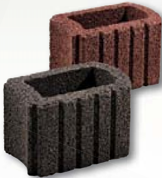
Bellaflor mini zwart/bruin 30 x 20 x 20 cm