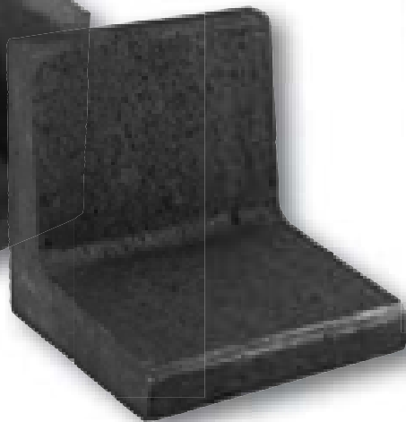
L-element zwart 40/50/60/80 x 40 x 40 cm