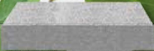
Traptrede grijs 100 x 35 x 16 cm