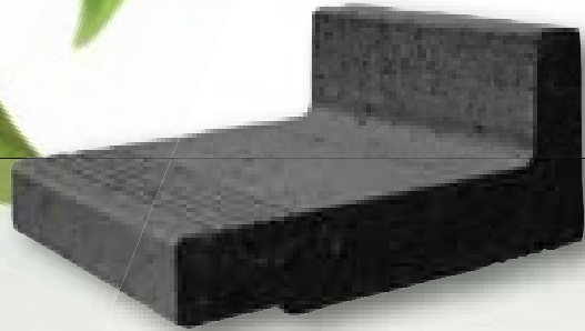
Traptrede mini (bouwelement) zwart 37 x 30 x 17 cm