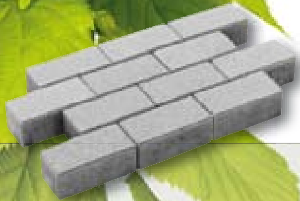
Betonklinker met deklaag grijs 8 cm