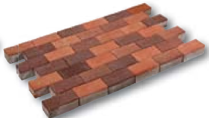
Betonklinker met deklaag lente bont 8 cm