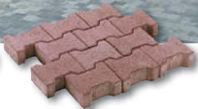
Betonklinker H-profiel met deklaag heide 8 cm