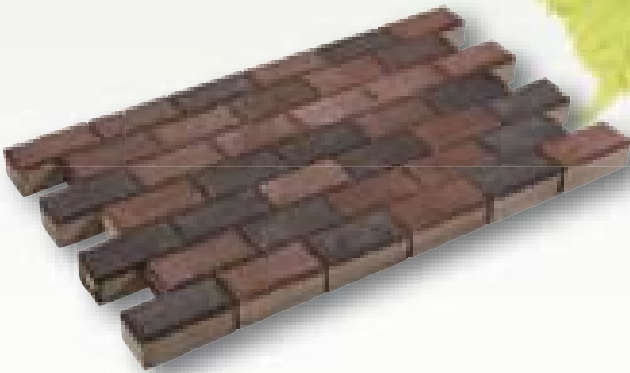
Betonklinker met deklaag bruin, zwart 8 cm