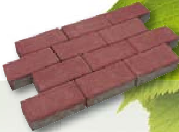
Betonklinker met deklaag rood 8 cm