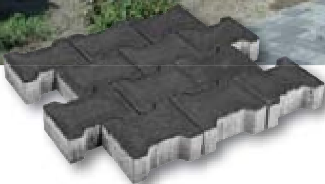
Betonklinker H-profiel met deklaag antraciet 8 cm