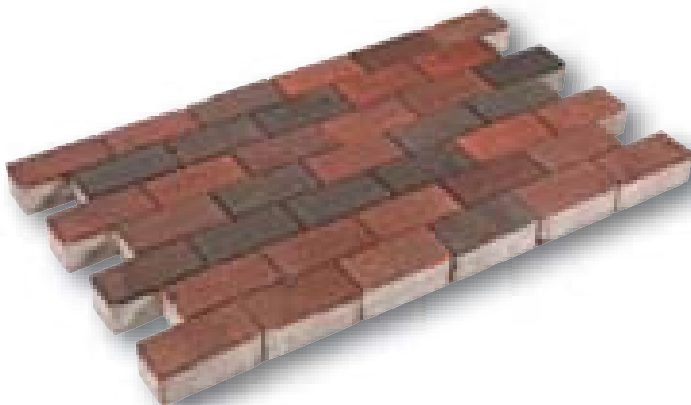
Betonklinker met deklaag rood, zwart 8 cm