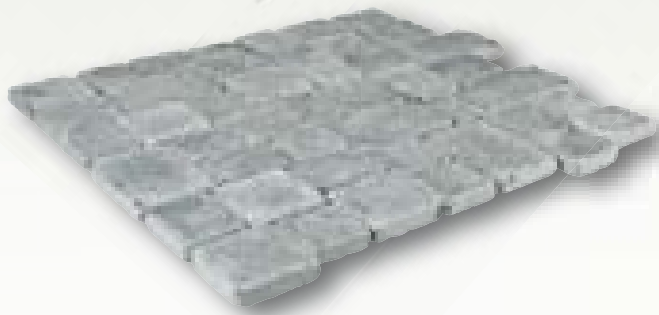
Blue Moon Anticato hardsteen, klinkerverband