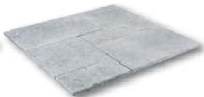
Anatolia Blue Anticato marmer, romeins verband