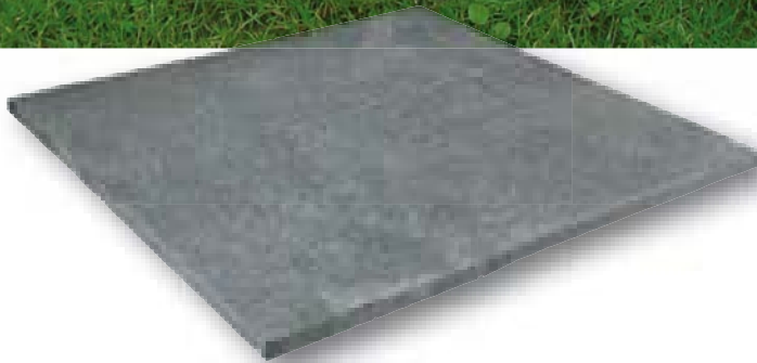
Tahiti Blue Elegance Linea graniet, romeins verband