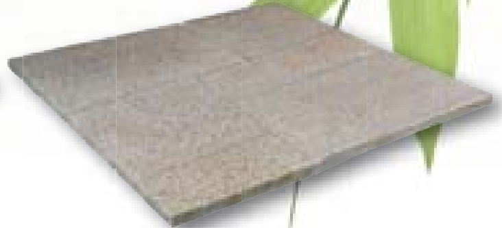
Pink Elegance Linea graniet, romeins verband