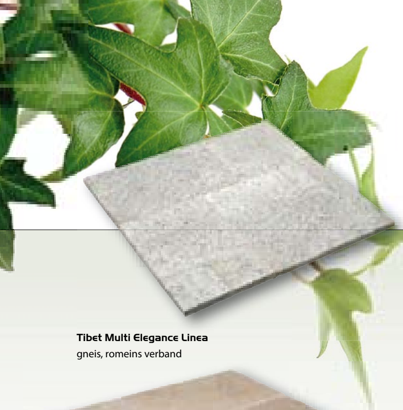
Tibet Multi Elegance Linea gneis, romeins verband