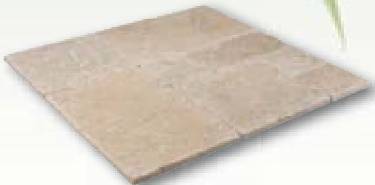
Anatolia Creme Anticato kalksteen, romeins verband