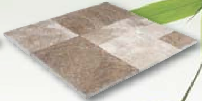
Travertino Romano Caramello Elegance romeins verband