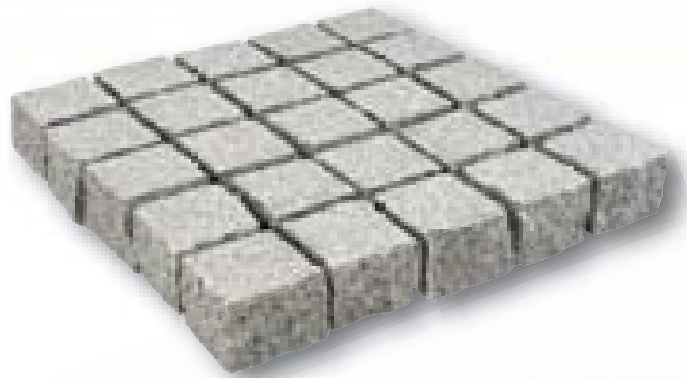
Kinderkoppen Padang graniet