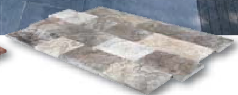
Travertino Romano Barocco Elegance banenverband