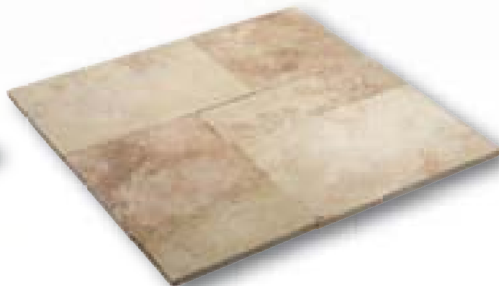
Travertino Romano Creme Elegance romeins verband