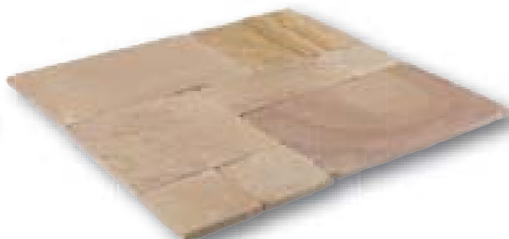
Modak Anticato zandsteen, romeins verband