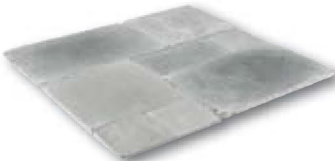
Riverside Grey Anticato kalksteen, romeins verband