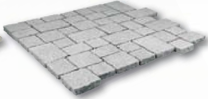
Padang graniet, klinkerverband