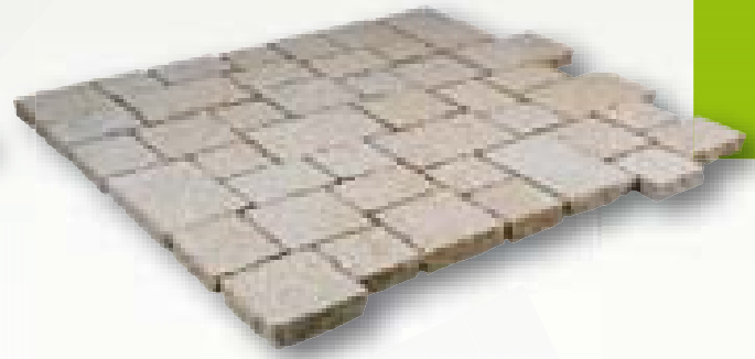
Safari graniet, klinkerverband