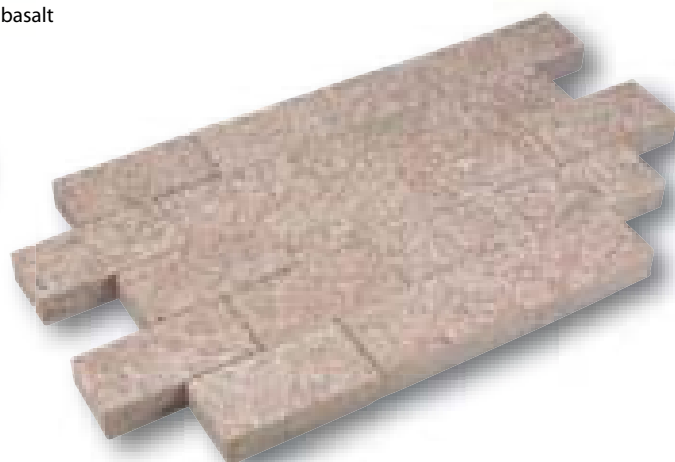
Klinker Ruby Red Linea graniet