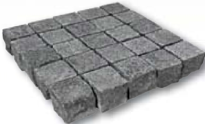
Kinderkoppen Nero Eleganto basalt