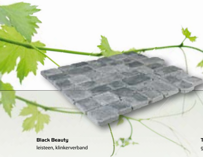
Black Beauty leisteen, klinkerverband