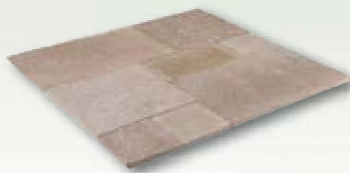
Patio Cadiz Anticato kalksteen, romeins verband