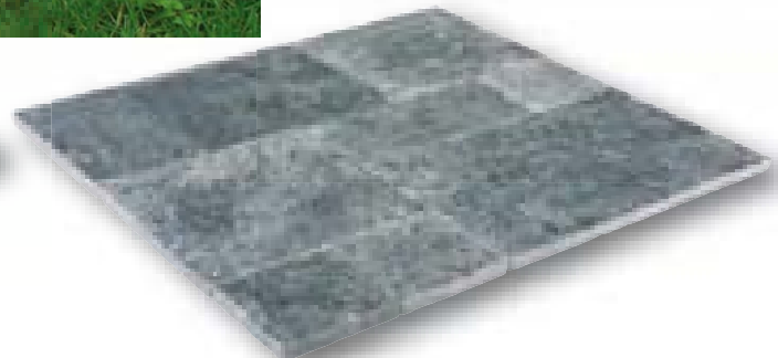
Anatolia Black Anticato marmer, romeins verband