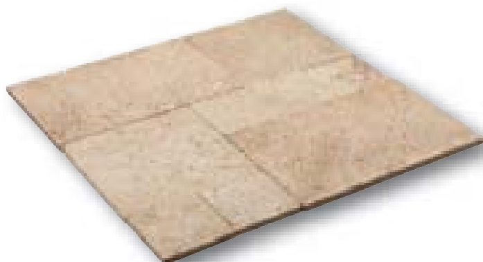
Travertino Romano Walnut Vintage romeins verband