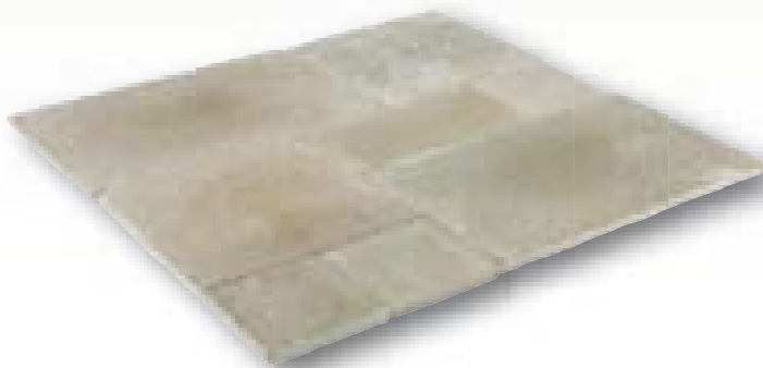
Riverside Brown Anticato kalksteen, romeins verband