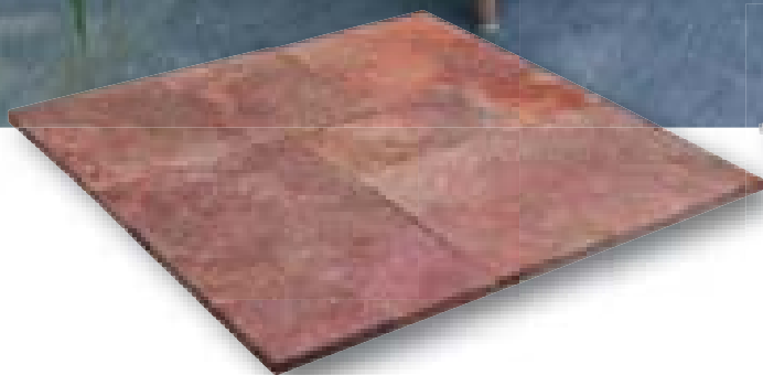
Travertino Romano Persian Red Elegance romeins verband