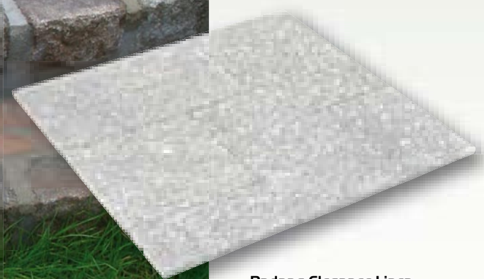
Padang Elegance Linea graniet, romeins verband