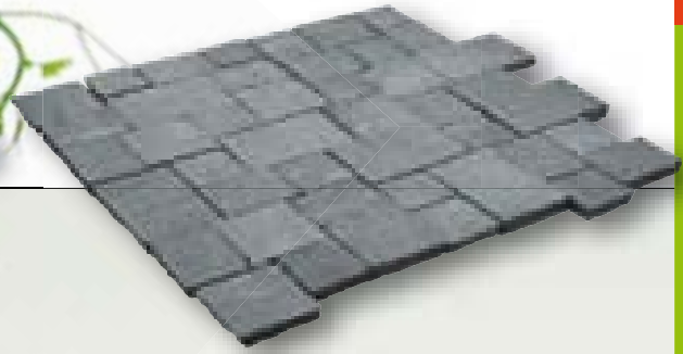
Tahiti Blue graniet, klinkerverband