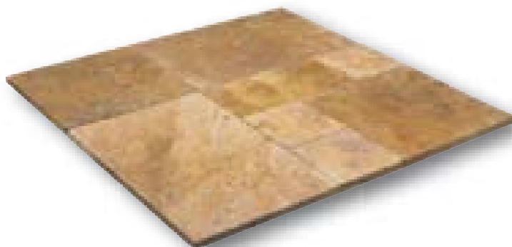
Travertino Romano Geel Elegance romeins verband