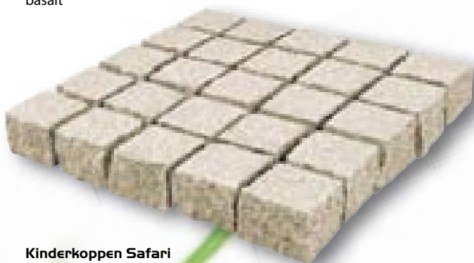
Kinderkoppen Safari graniet