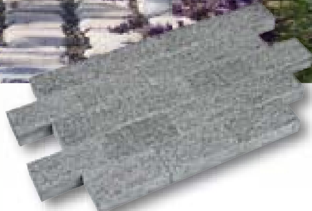
Klinker Nero Eleganto Linea basalt