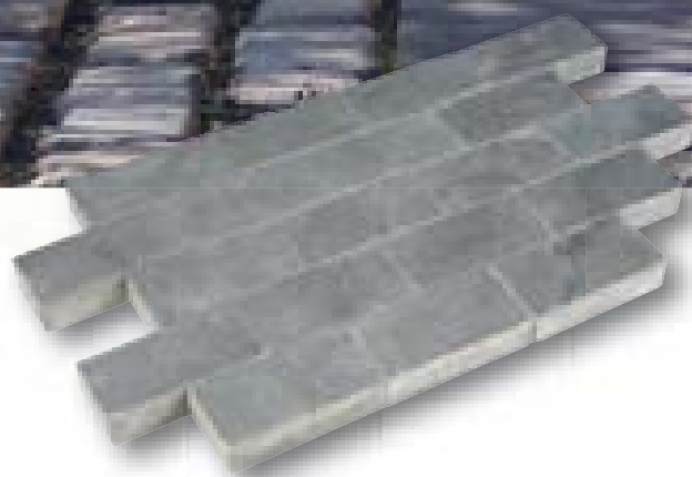
Klinker Blue Moon Linea hardsteen