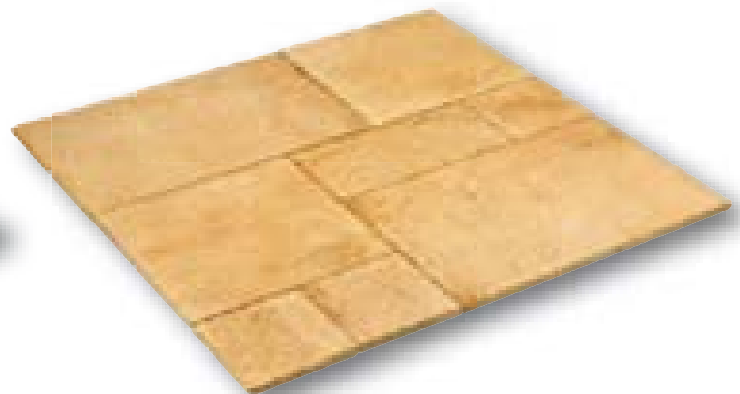
Riverside Yellow Anticato kalksteen, romeins verband