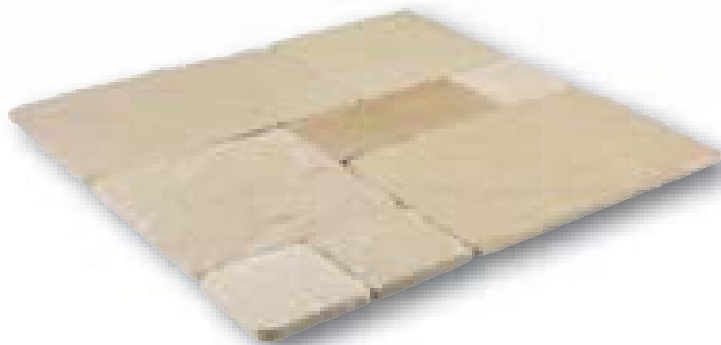
Mint Anticato zandsteen, romeins verband